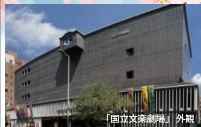
「国立文楽劇場」 外観