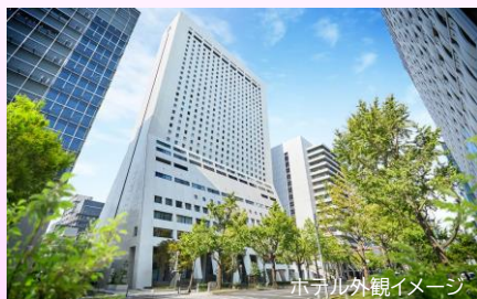
ホテル外観イメージ