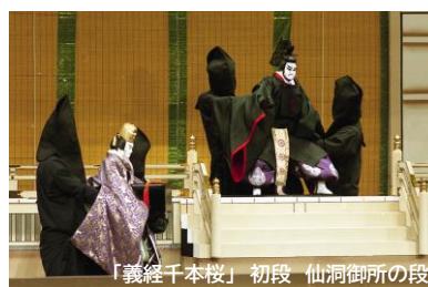
「義経千本桜」 初段 仙洞御所の段

通し狂言「義経千本桜」 第一部 午前10:30開演 初段 仙洞御所の段 堀川御所の段 二段目 伏見稲荷の段 渡海屋・大物浦の段