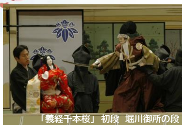
「義経千本桜」 初段 堀川御所の段